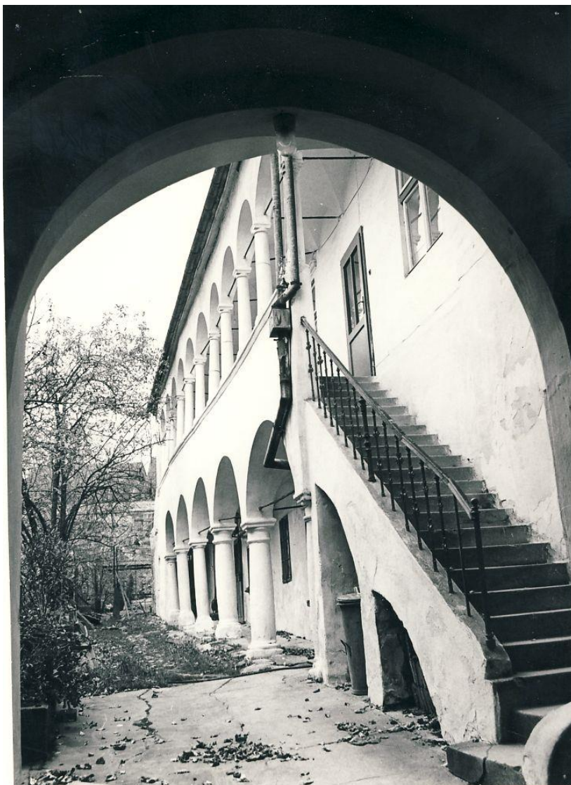
Nádvoří domu U Synků v 70. letech 20. století.