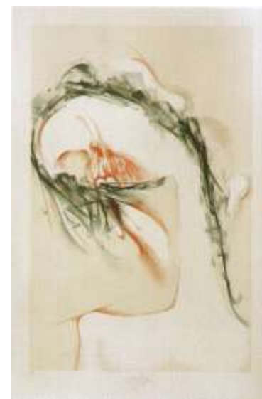
Niterný vztah, 1985, litografie

Retrospektivní ohlédnutí za více než 50letou tvorbou nabízí soubor grafických listů provedených technikou litografie a hlubotisku. Autor užívá především litografický kámen, na který přímo kreslí štětcem nebo mastnou křídou. Podobně jako na svých obrazech komponuje pomocí vrstvení, překrývání, zesilování či utlumování výrazových linií základní tvary nesoucí hluboké významy.